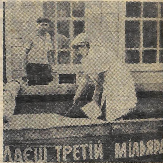
До хлібопримамального пункту надійшло зерно нового врожаю.

Питання про ідеологічне забезпечення жнив члени комітету комсомолу колгоспу «Дружба» розглянули ще під час комплектування комсомольсько-молодіжних екіпажів. За кожним з них за-