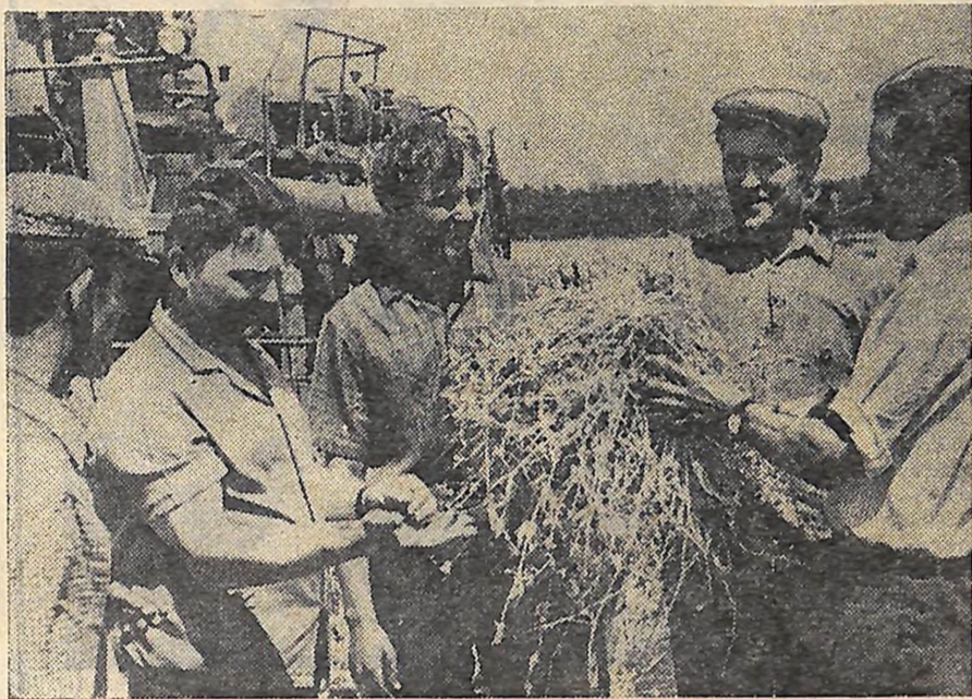
Щедро вродив горох: не менше двадцяти двох центнерів з гектара.