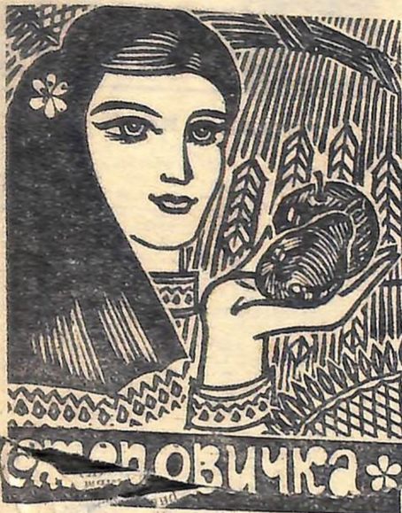
СТОРІНКА ДЛЯ ДІВЧАТ

1975 РІК ВІДЗНАЧАЄТЬСЯ ЯК МІЖНАРОДНИЙ РІК ЖІНКИ, НОМУ ПРИСВЯЧУЄТЬСЯ І ДЕНЬ РАДЯНСЬКОЇ МОЛОДИ. ЖІНКА — МАТИ, СЕСТРА, ДРУЖИНА, ПОДРУГА. ЖІНКА — ПЕРЕДОВИЙ ВИРОБНИЧНИК, УЧАСНИЦЯ ВІЙНИ, АКТИВНИЙ ГРОМАДСЬКИЙ ДІЯЧ. ПРО НИХ — СЬОГОДІШНІЙ ВИПУСК «СТЕПОВИЧКИ».