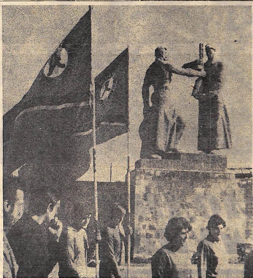
КОЛИ СВЯТО ПРИХОДИТЬ ДО НАС — ПАМ'ЯТЬ ПОМНОЖУЄ РАДІСТЬ НА ТИСЯЧІ, ТИСЯЧІ БЕЗСМЕРТНИХ ІМЕНІ. І ЧЕРВОНІ ГВОЗДИКИ ШАННІ І ЛЮБОВІ ЛЯГАЮТЬ ДО ОБЕЛІСКІВ І БРАТСЬКИХ МОГИЛ. В ТРУДОВІ БУДНІ — НАТХНЕННЯ МОЛОДИХ — ЗА СЕБЕ «І ЗА ТОГО ХЛОПЦЯ», ЩО НЕ ПОВЕРНУВСЯ З ПОЛЯ БОЮ. ТАК ПРАЦЮЮТЬ І НА «ЧЕРВОНІЙ ЗРІЧІ» ЯКІ Б ТОРЖЕСТВА НЕ ВІДБУВАЛИСЯ НА ЗАВОДІ. КОМСОМОЛЬЦІ, МОЛОДЬ ПОЧИНАЄ ІХ ЗВІДСИ — ВІД ПАМ'ЯТНОГО ЗНАКА ЧЕРВОНОЗОРІВЦЯМ, ЯКІ ЗАГІНУЛИ НА ВІЙНІ.

О. ШЕВЧЕНКО, завідуючий відділом комсомольських організацій Світловодського міському ЛКСМУ.