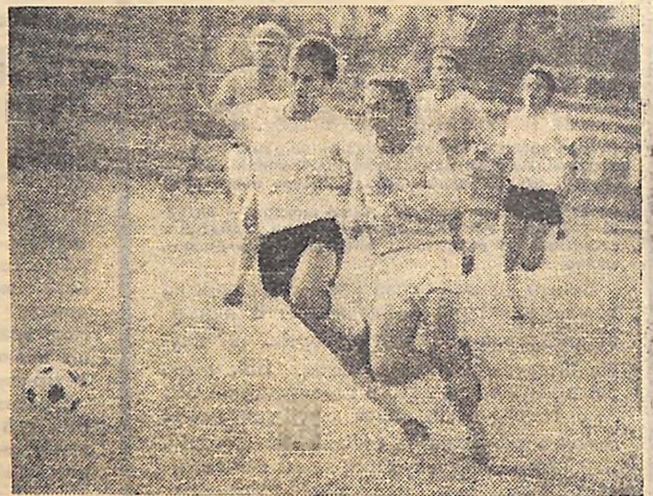
СТАДИОН СПОРТКЛУБУ «ЗІРКА». КІРОВОГРАДСЬКІ ФУТБОЛІСТИ ВЗЯЛИ ВЕРХ НАД «КРИВБАСОМ».