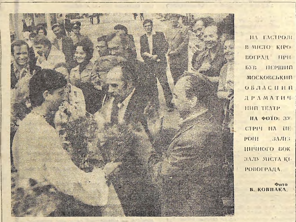
НА ГАСТРОЛІ В МІСТО КІРОВОГРАД ПРИБІВ ПЕРШИЙ МОСКОВСЬКИЙ ОБ'ЄДИНЕНИЙ ДРАМАТИЧНИЙ ТЕАТР. НА ФОТО: ЗУСТРІЧ НА ЦЕРКОВНОМУ ЗАМІСЦІ ПИЧНОГО ВОКЗАЛУ МІСТА КІРОВОГРАДА.