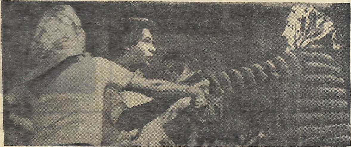
З великим успіхом в Кіровограді проходять гастролі Першого Московського обласного драматичного театру. НА ФОТО: СЦЕНА З ВИСТАВИ В. РОЗОВА «СИТУАЦІЯ».