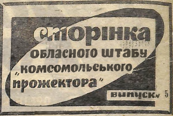
Регулярно виходять випуски «Комсомольського прожектора» на заводі ім. Кірова м. Кіровограда.