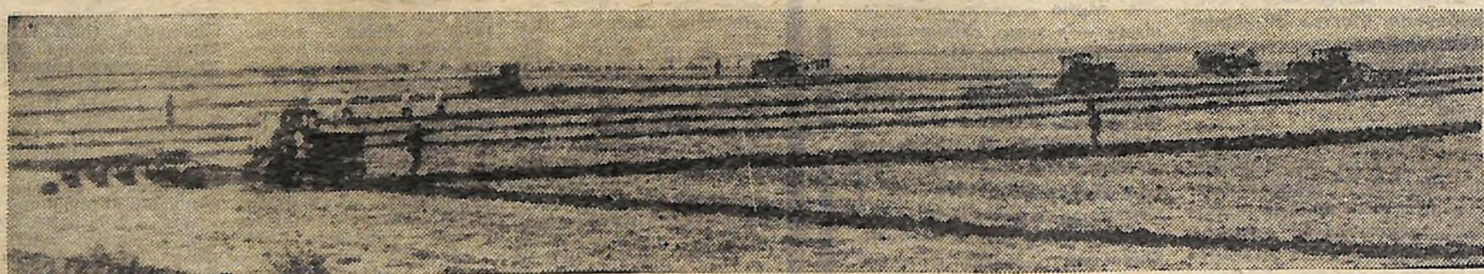
3 РОБІТ ФОТОВИСТАВКИ.