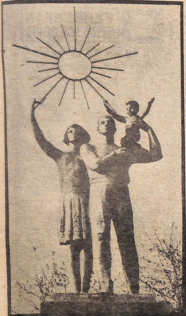
Голованівськ. Ця скульптурна група стоїть перед в'їздом в селище.