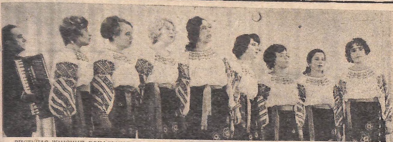
ВИСТУПАЄ ЖІНОЧІЙ ВОКАЛЬНИЙ АНСАМБЛЬ БУДИНКУ КУЛЬТУРИ ВИРОБНИЧОГО ОБ'ЄДНАННЯ «ДНПРО-ЕНЕРГОБУДІНДУСТРІЯ».