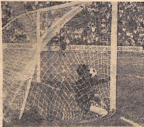
На фото: так був забитий вирішальний гол. Олексій КАЦМАН сильним ударом послав м'яча у лівий кут воріт. Воратар майже перепинив йому шлях, але втрапив рівновагу і опинився разом з м'ячем у воротах.