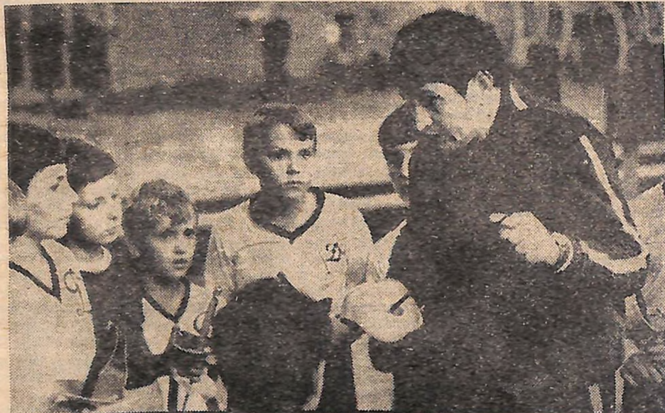
КНІВ. У спеціалізованій ДЮСШ товариства «Динамо» підготовлено за останні роки понад 30 майстрів спорту