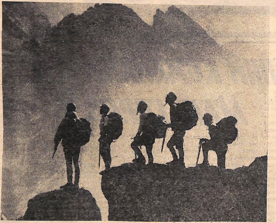
Дуже популярний у молоді Харкова альпінізм. Сотні любителів цього захоплюючого виду спорту — робітники, службовці, студенти — відвідують заняття його секцій, багато хто з них має спортивні розряди, бере участь у щесюєних і міжнародних змаганнях. Недавно група харківських альпіністів побувала на Кавказі, де здійснювала сходження на гірській вершині. На фот.: перед сходженням.