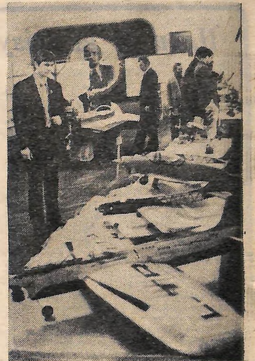
На технічній виставці, яка працювала під час проведення конференції.

і політичної підготовки, класними спеціалістами, спортсменами-розрядниками.