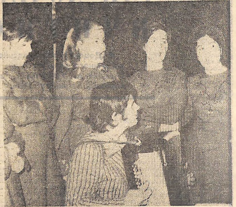
Велику популярність мають виступи вокально-інструментального ансамбля «Вільшаночка» Вільшанського Будинку культури. Створено цей творчий колектив 1968 року. Ансамбль не раз брав участь в обласних оглядах-конкурсах, фестивалях самодіяльного мистецтва.