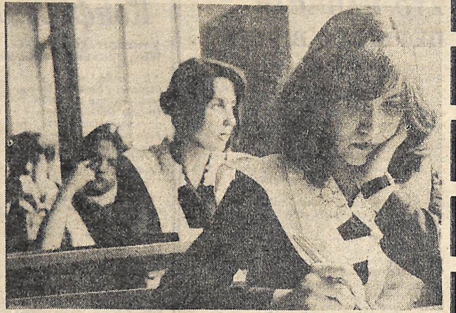
Сьогодні — збір, завтра — життя. Сьогодні — екзамен у школі, завтра... Хто скаже, де буде — не завтра? У аудиторії чи в заводському цеху, в училищі чи на колгоспному полі? Про нього стільки говорять — про майбутнє, стільки продумано, вирішено, але чи вистачить сил і знань, аби відстояти свою мрію? Сонячний зайчик падає на сторінку зошита, золотить перепрохані рядки скоронису. Рядки останнього шкільного твору. Відповідає на одне з останніх екзаменів. Наступні іспити — у житті.

ближчої тракторної бригади, куди не завжди привозили учителі на урок праці? А тому, роблячи висновки з анкети «Розкажіть про мою професію», ми задовольнятимемо не тільки запити «переможців», а й друкуватимемо репортажі з підприємств, інтерв'ю з людьми праці, керівниками технічних навчальних закладів. Значить, будуть і розповіді про спеціальності, які не набрали максимальної кількості балів у юних читачів, але які потрібні для того, щоб наша Кіровоградщина була ще багатшою, ще красивішою. Бо ж жити вам — у реальному суспільстві. О. РАКІН.