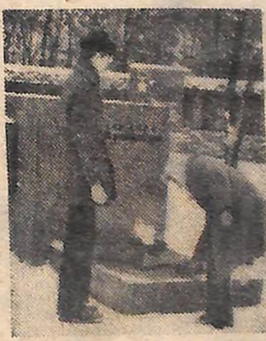
Читайте 3-ю стор.