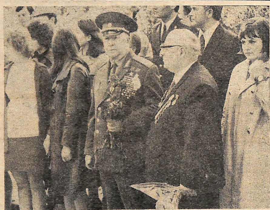
На фото: О. І. РОДІМЦЕВ серед кіровоградців. Травень 1975 року.

О. ЖАДОВ, генерал армії, Герой Радянського Союзу.