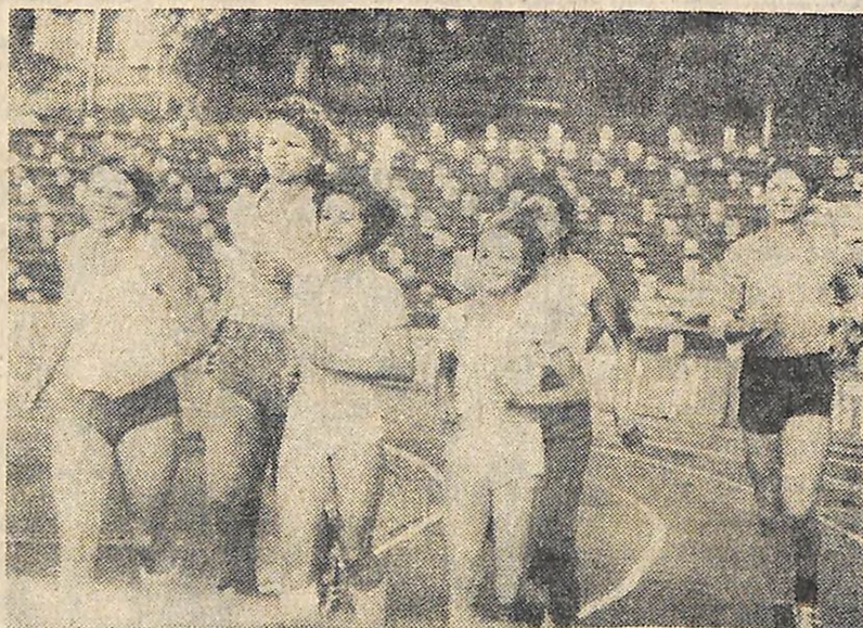
Юні легкоатлети Кіровограда перед спартакіадними подсинками.

У день свята ми підбиваємо підсумки своєї роботи, визначаємо шляхи подальшого руху вперед, аналізуємо причини упущень.