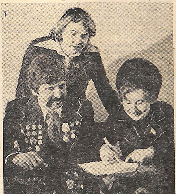
Як ми вже повідомляли, минулого тижня в обласному ЛКСМУ України відбулася зустріч з лауреатами премії Ленінського комсомолу.

В. НУЖНИЙ, громадський кореспондент «Молодого комуніста».