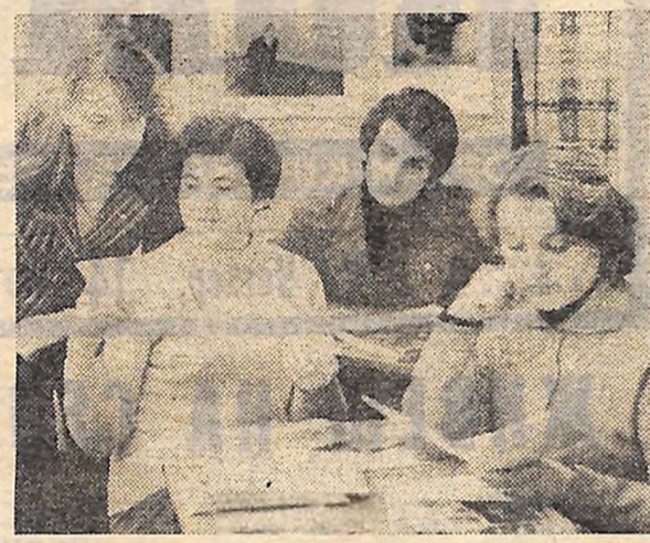
Молоді виборці в агітпункті.

ЦК ВЛКСМ, Міністерство меліорації і водного господарства СРСР, Державний комітет СРСР по виробничо-технічному забезпеченню сільськогосподарства і Державний комітет СРСР по професійно-технічній освіті висловили тверду впевненість, що комсомольські організації, юнаки і дівчата села візьмуть активну участь у Всесоюзному огляді і екзамєні технічної підготовки сільської молоді, внесуть гідний вклад у боротьбу за втілення в життя ленінської аграрної політики Комуністичної партії Радянського Союзу.