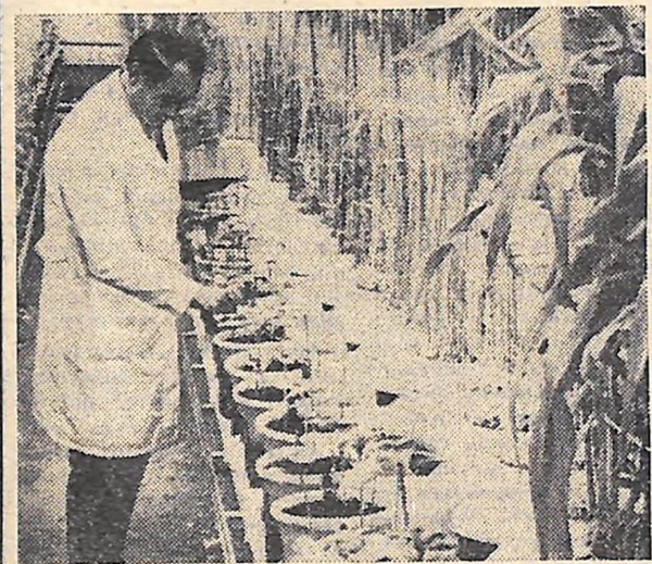
ІІПР. Спеціалісти науково-дослідного інституту сільськогосподарства в місті Пулаві досліджують можливість застосування золь теплоелектростанцій для удобрення ґрунту в теплицях. Учені інституту виявили, що ця зола містить багато мікроелементів, які збагачують ґрунт і сприяють швидкому росту рослин. На знімку: в теплицях інституту.