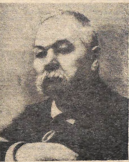
М. Л. КРОПИВНИЦЬКИЙ.

Усвідомлюючи значення їхньої творчості, почувашь гордість за свій край. На Єлисаветградщині народився зріс Марко Кропивницький. Тут набрався він творчої сили і злетів орлом у широкий світ мистецтва. Знов і