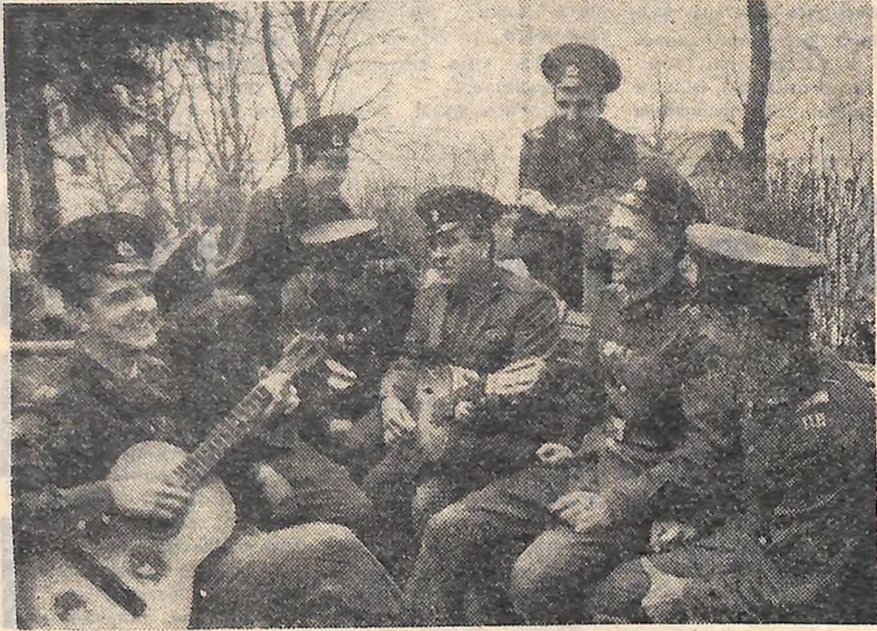
Червонопрапорний Західний прикордонний округ. Пильно несуть службу воїни-прикордонники, охороняючи священні рубежі Батьківщини. Систематично вдосконалюючи бойову виучку і політичну підготовку, вони постійно оволодівають секретами прикордонної майстерності. На зйомку: в години відпочинку.