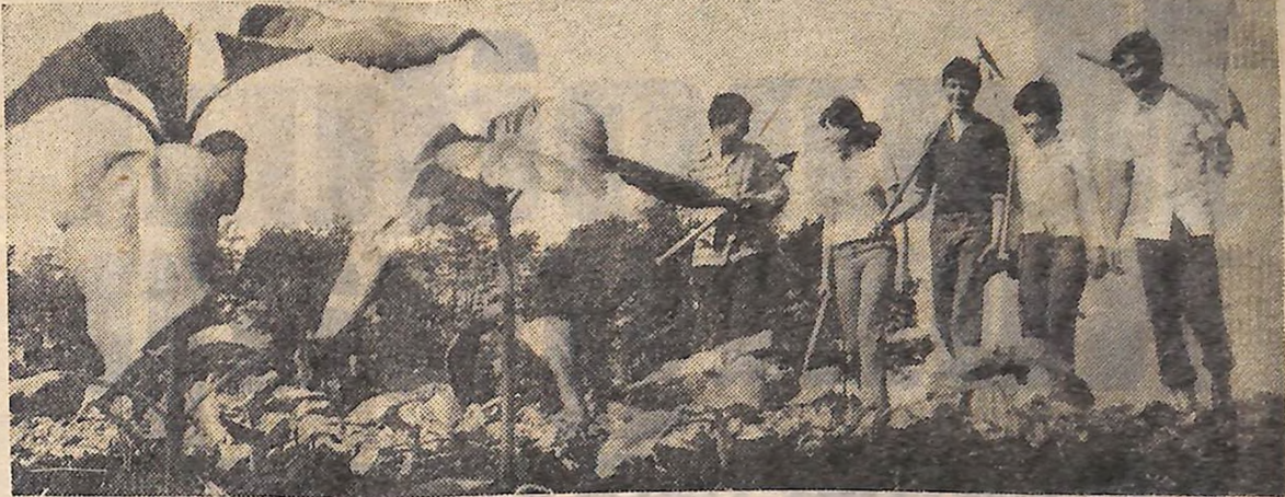
Старанно доглядають за посівами соняшнику нового сорту «ранньостиглий» члени учнівської виробничої бригади Вільшанської середньої школи.

По доповіді секретаря Президії Верховної Ради СРСР М. П. Георгіадзе депутати затвердили Укази Президії Верховної Ради СРСР і прийняли відповідні закони і постанови.