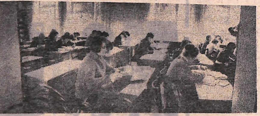
У читальному залі бібліотеки Кіровоградського педагогічного інституту імені О. С. Пушкіна.