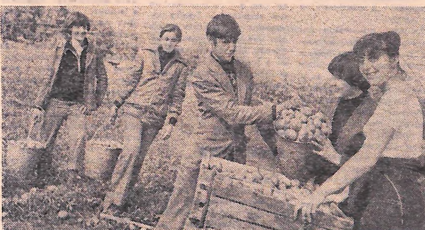
Велику допомогу колгоспові «Україна» Голованівського району подали під час «малого трудового» учні Кіровоградського машинобудівного технікуму, щодень виконуючи завдання на 125 процентів. На знімку: за роботою. (Знімок зроблено в останній день перебування учнів у колгоспі.)