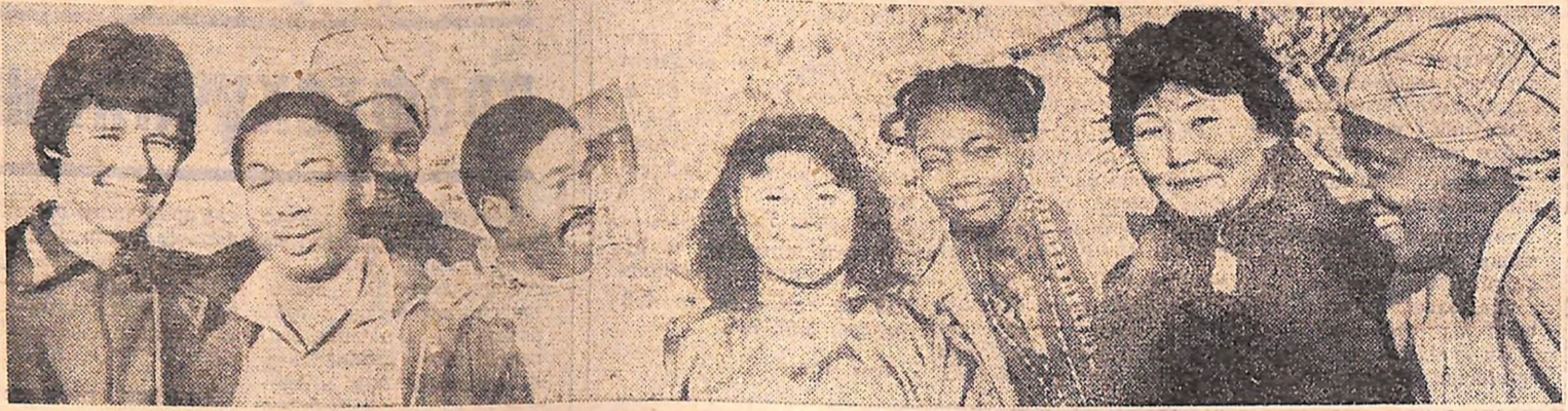
Однією дружною сім'єю живуть і навчаються в Кіровоградському медичному училищі посланці Конго й Анголи, Лаосу і Монголії,