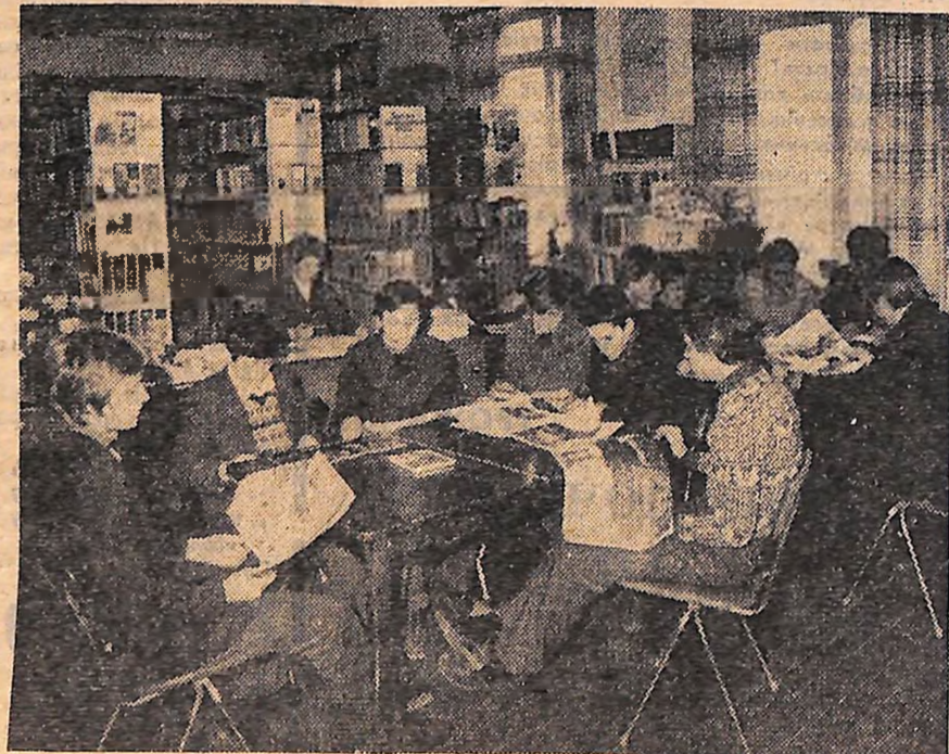
У читальному залі бібліотеки Новгородківського СПТУ № 6.

«Щоб усунути аварію на вулиці Повітрянофлотській, необхідно відключити водогін, який забезпечує водою молокозавод і м'ясокомбінат. Тому вирішено ввести в експлуатацію Злодійський водозаслін. Нині витік води на вулиці Повітрянофлотській, 6 і Менделєєва, 41 припинено».