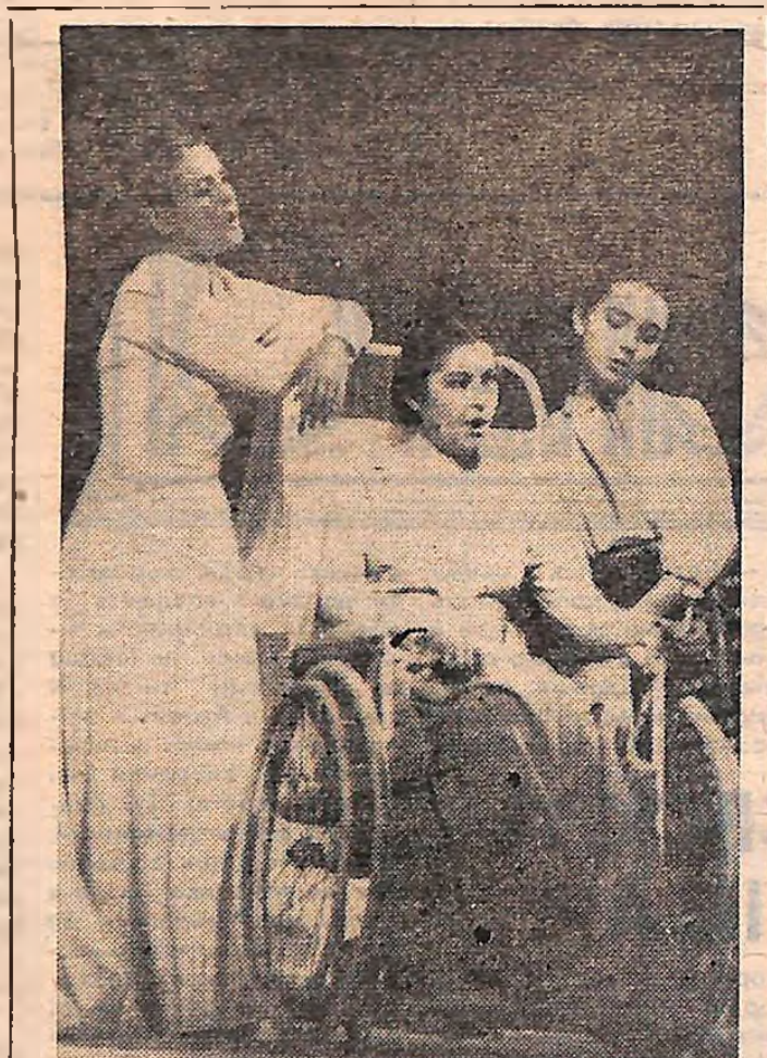
На знімку: заслужена артистка УРСР В. ЗАКЛУВНА (в центрі) та народна артистка СРСР А. РОГОВЦЕВА з дочкою Катєю СТЕПАНКОВОЮ.