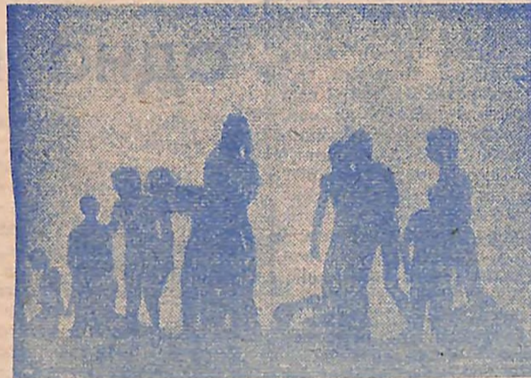
На пляжі сонячної Болгарії.