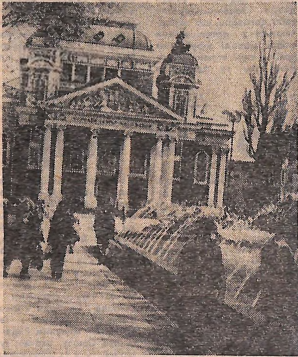
На знімку: один із найулюбленіших куточків відпочинку мешканців столиці Народної Республіки Болгарії.