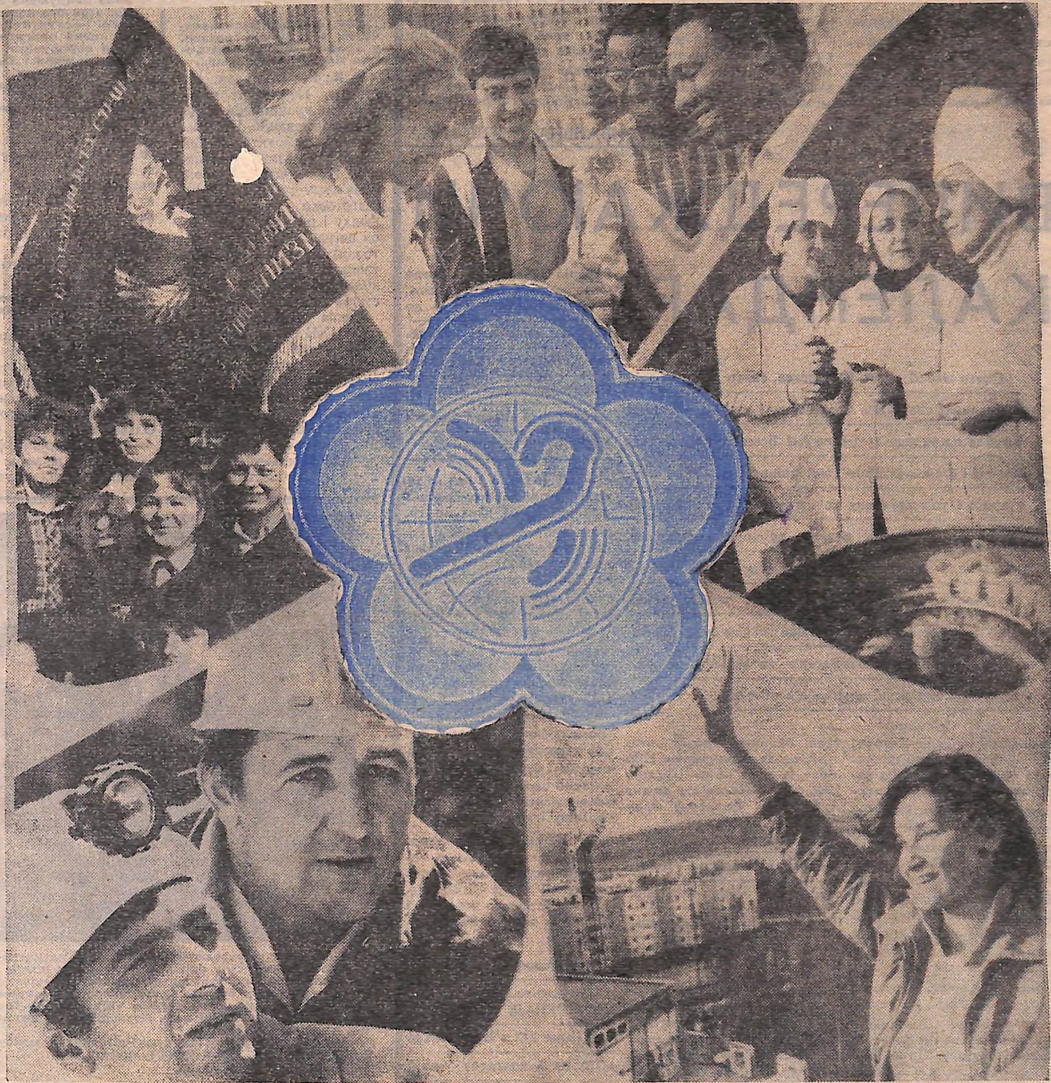
Фотомонтаж В. ГРИБА.

Не випадково сьогоднішній номер журналісти «Молодого комунара» готували спільно із колегами з молодіжного видання «Надмчк» тольбухівської окружної газети «Добруджанська трибуна». У номері йдеться про трудовий ентузіазм молодих тольбухівців і кіровоградців у праці назустріч фестивалю, про їхній вклад в ударні фестивалеві справи ДКСМ та ВЛКСМ. Яким буде фестиваль? Яким уявляють його організатори молодіжного форуму? Як позначається участь у підготовці до фестивалю на житті й щоденних справах спілчанських організацій Кіровоградщини й Добруджі? Відповіді на ці та інші запитання ви знайдете у сьогоднішньому номері нашої газети. Віп — про нашу мирні справи, про нашу дружбу й взаєморозуміння.