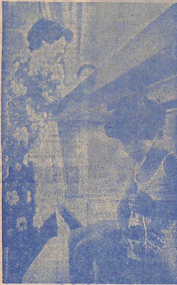
Як сумно самому!