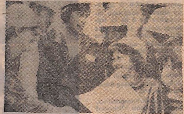
Вони проходять у рамках культурної програми; хореографічний ансамбль «Пролісок» Кіровоградського обласного Палацу піонерів та школярів

Віа розмову П. СЕЛЕЦЬКИЙ. Москва — Кіровоград.