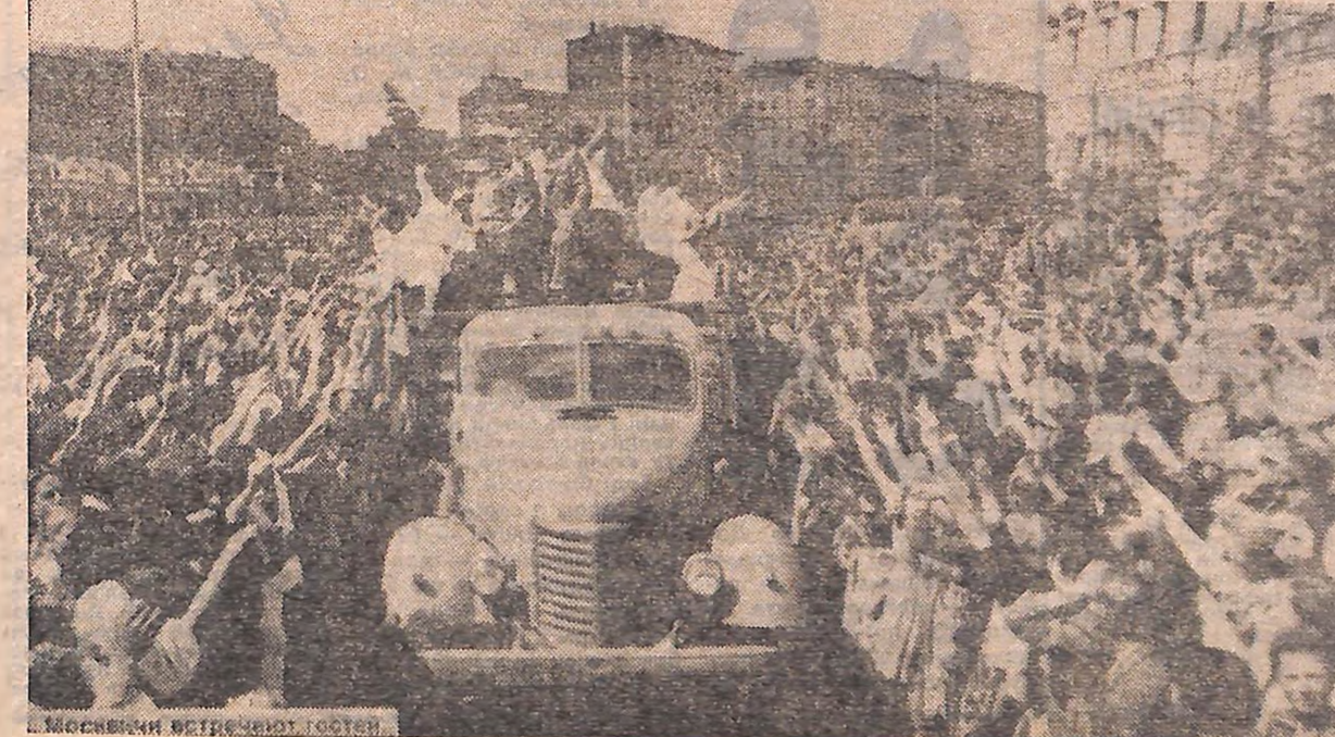
Москва в день закриття фестивалю

заступник директора по навчально-виховній роботі Олександрійського СПТУ № 7, делегат VI Всесвітнього фестивалю молоді і студентів у Москві 1957 року.