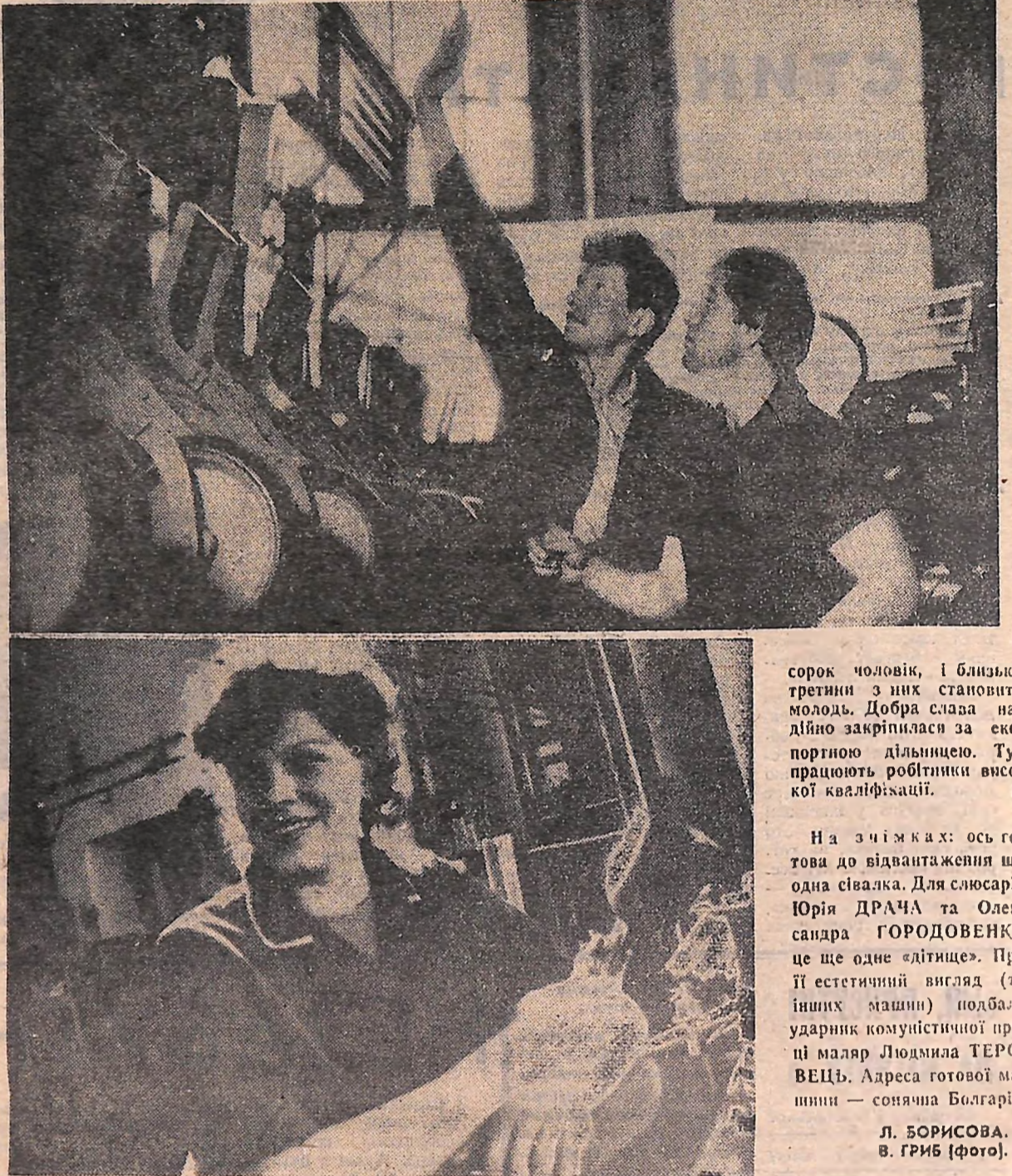
сорок чоловік, і близько третини з них становить молодь. Добра слава надійно закріпилася за експортною дільницею. Тут працюють робітники високої кваліфікації.

Дільниця механоскладального цеху № 1, де збирають сівалки на експорт, невелика. Працює тут