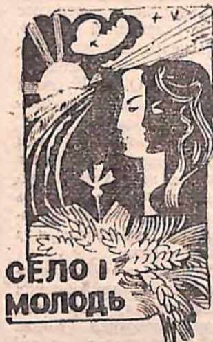
СЕЛО І МОЛОДЬ