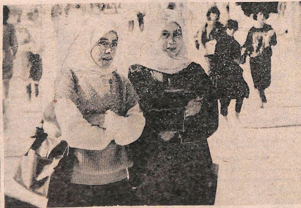
ІОРДАНІЯ. Підготовка кваліфікованих спеціалістів — запорука успішного розвитку національної економіки. Розширенню системи освіти в країні надається чимало уваги. На знімку: студентки з Аммана.

Справді, люди в Галенбеку не відчувають різниці між своїм побутом і міським. У всіх будинках водогін і каналізація. Йдучи єдиною вулицею Галенбека, бачимо на ній і нові будівлі з підземними гаражами і старі — з високими дахами, але мо-