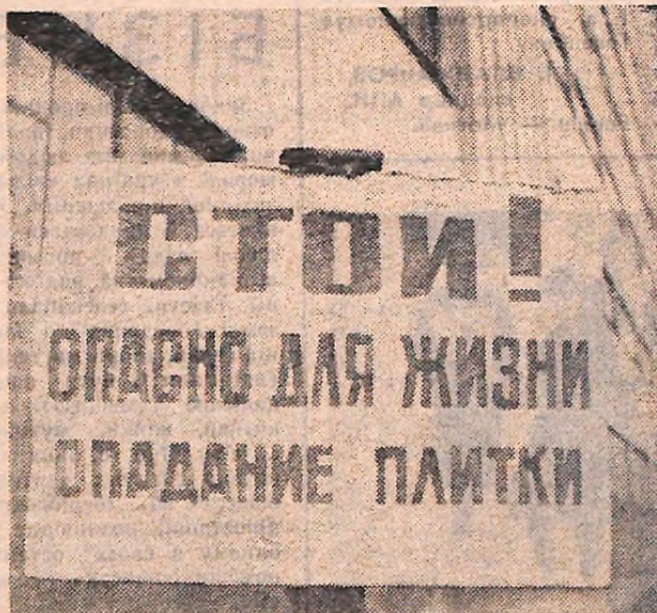
початку було відомо, що вони триматися не будуть. Тільки два роки тому будинок «попливали», а нині вже висить там попереджувальна об'ява.

Але якщо тут, не ловлячи гав, ще можна пройти, то до Кіровоградської телефонно-телеграфної станції взагалі, як бачите, підходити небезпечно. Дуже хотілося б знати, як могли будівельники колишнього тресту «Кіровоградмашвазбуд» (нині «Кіровоградбуд») додуматися бетонний будинок обиладати нахлями, адже від самого