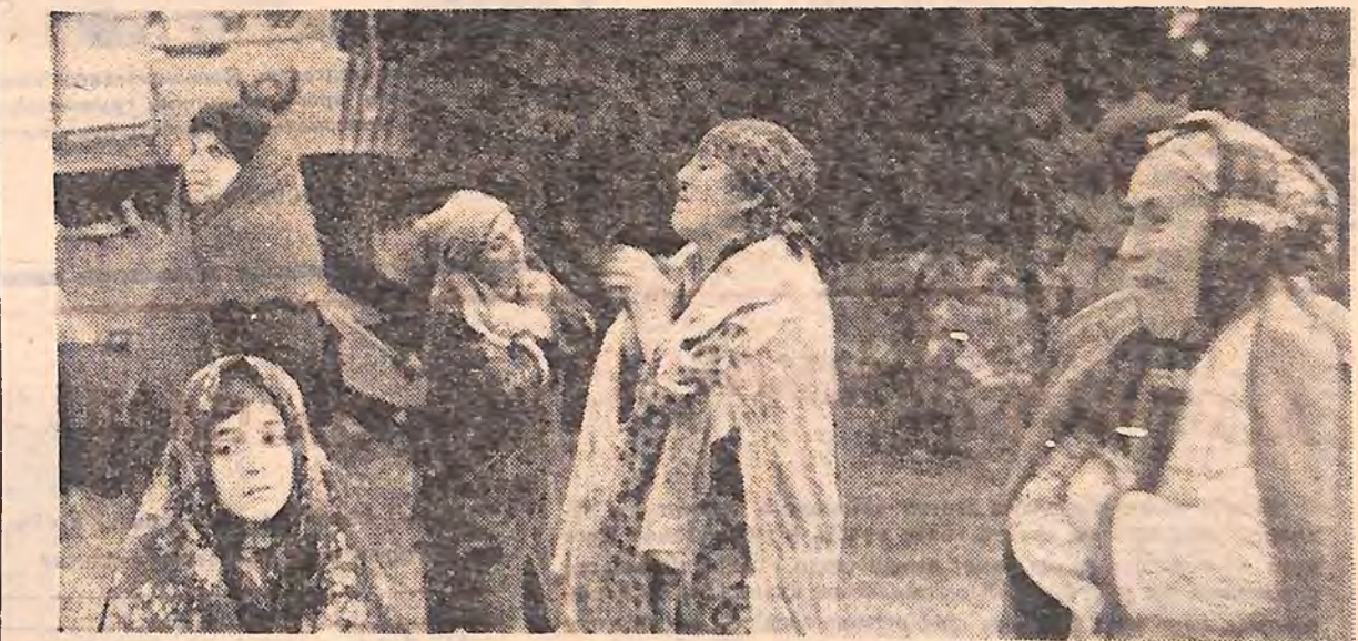
ВІРМЕНСЬКА РСР. На знімку: з чим порівняти лихо цих жителів міста Спітак, які втратили рідних!

На минулому суботнику трудівники виробничого швейного об'єднання обласного центру пошили для вірменських дітей 300 пальт. Крім того, у фонд допомоги потерпілим від землетрусу цим підприємством