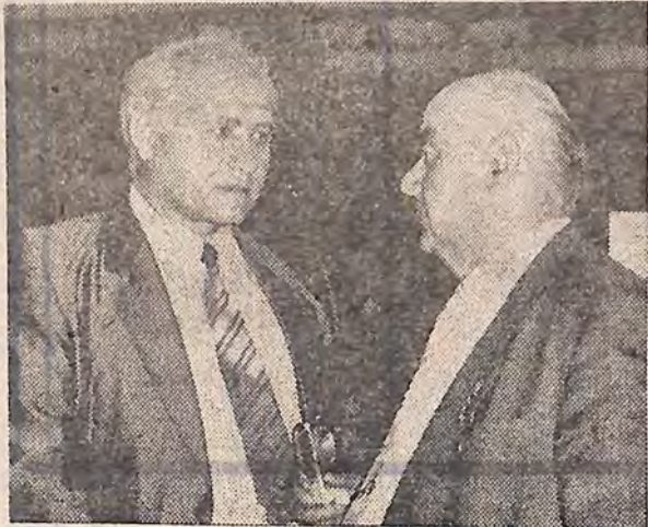
Бесіди, в перерві.