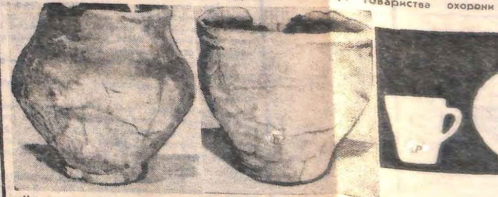
На знімку: зразки гончарних виробів Сабатинівської культури.

Питання це поки що залишається без відповіді. Розмова з новопризначеним на той момент функціонером районної організації Товариства охорони