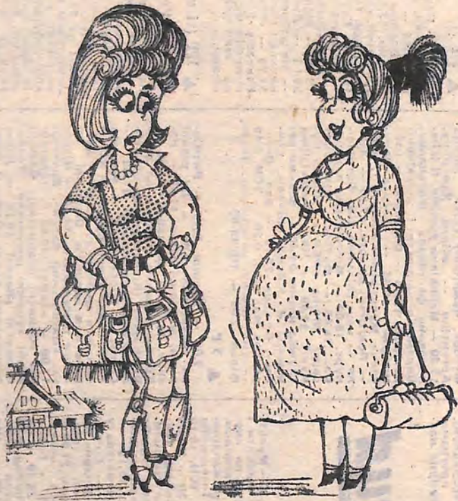
— Це я «ламбату» танцювала...