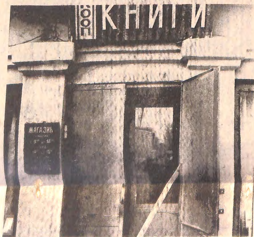
І учився б — не дають...