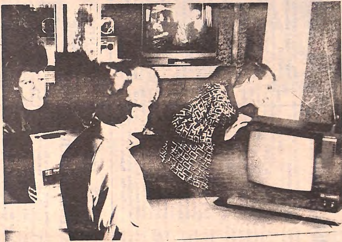
Якщо у вас, шановні друзі, є речі, якими не користуєтесь, не вагайтесь, несіть у комісійний магазин. І не в будівлі «Мірю», що знаходиться по вул. Пушкіна, а в «Мірю», що знаходиться по вул. Пушкіна. Тут не лише встановлять ціну за домовленістю, а й швидко продадуть товар, взявши з вас лише 5-10% від вартості речі. Ну, а що обслуговують приватні продавці — підіть, подивіться. Багато йти зразу з грошима — в магазині є що купувати.

Вирішення питання про надання відстрочки від призову не користується. Вирішення питання про надання відстрочки від призову не користується. Вирішення питання про надання відстрочки від призову не користується.