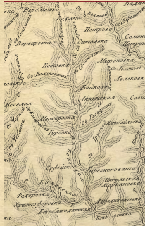
Фрагмент карти 1799 р

з 12.1821 - в окрузі Новоросійського полку 3-ї Кірасірської дивізії Новоросійських військових