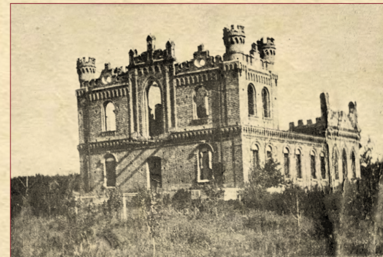
Палац Буцьких (залишки)

поч. XX ст. – будівництво нового мурованого храму (за спогадами жителів - церква Святої Варвари),