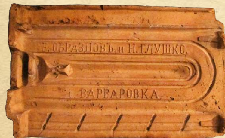
черепиця з варварівського заводу