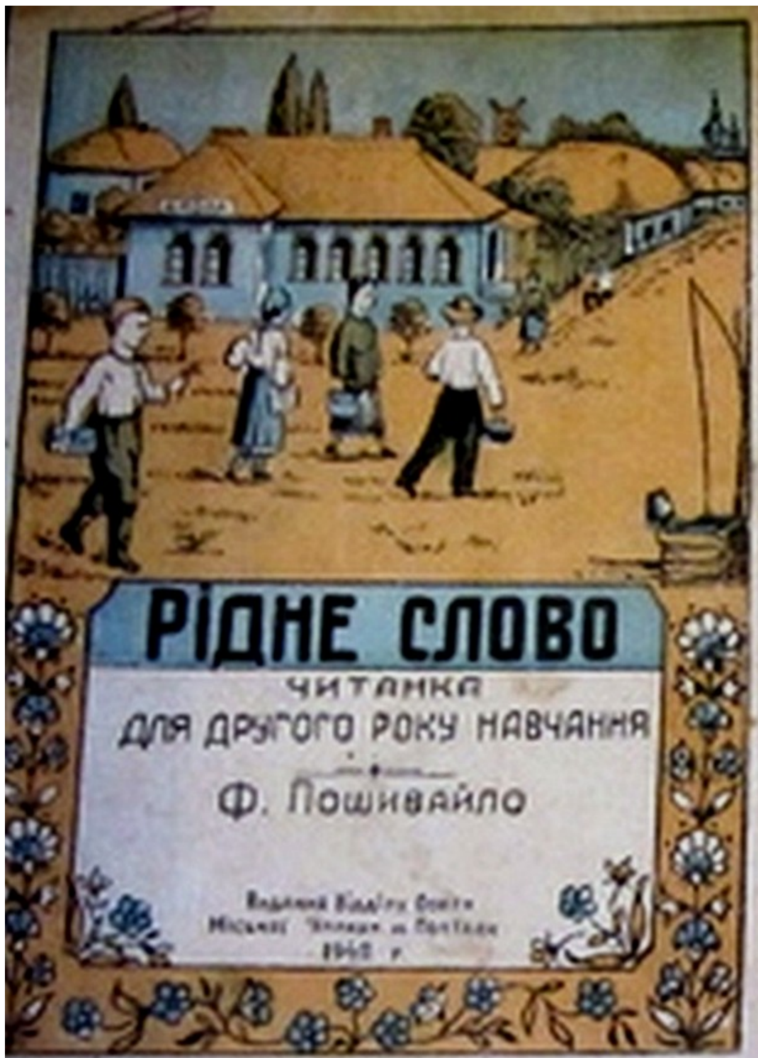
Рідне слово: підручник для 2 кл. (авт. Ф.Пошивайло), 1942 р.