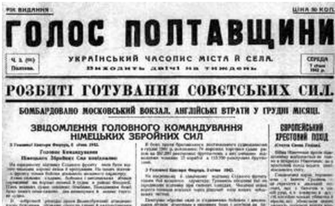
Газета Полтавського гебітскомісаріату