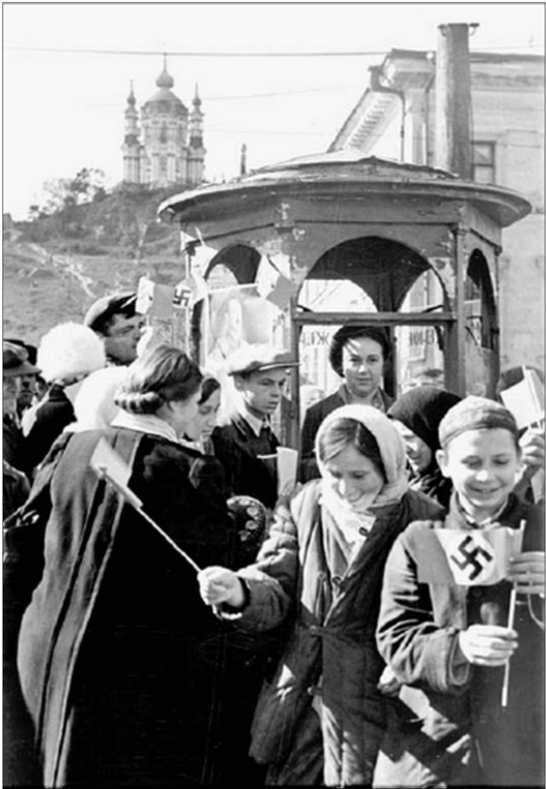
м. Київ, 1941 р.