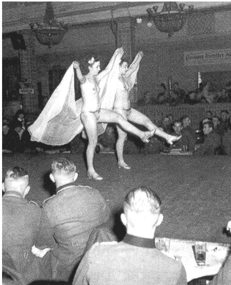
У театрі вар'єте