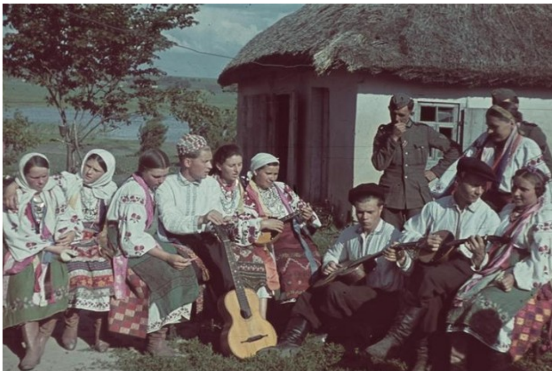
iesarchiv, Bild 169-0166 : o. Ang. | 1941 Sommer