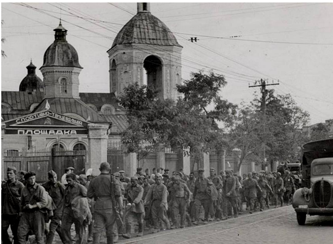
Колона військовополонених червоноармійців біля Свято-Успенського собору, м. Кіровоград, вул. Велика Перспективна