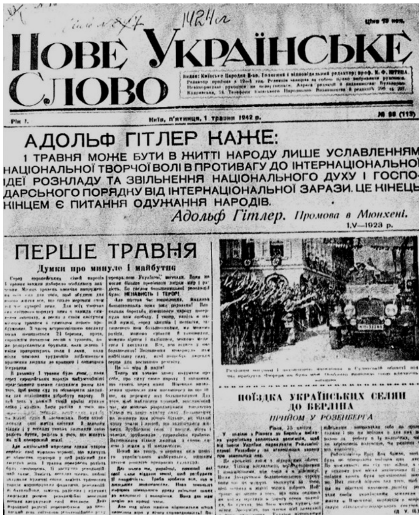
«Нове українське слово» – газета генерального округу «Київ»