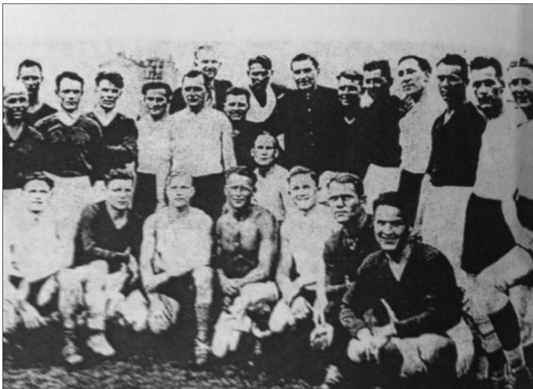
Українські та німецькі футболісти після так званого «матчу смерті», 9 серпня 1942 р. З книги В. Пристайка