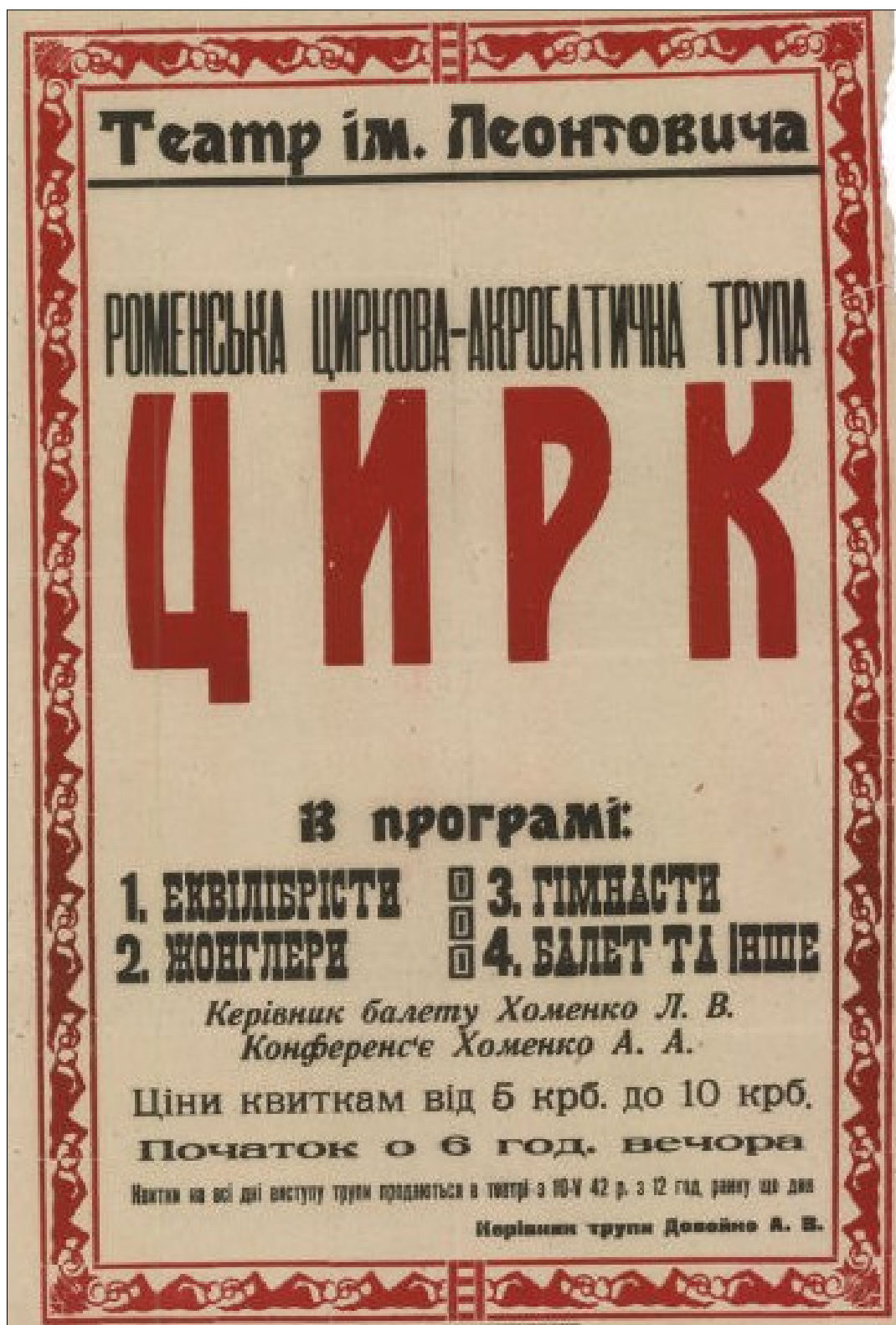
Афіші міського театру (м. Ромни).