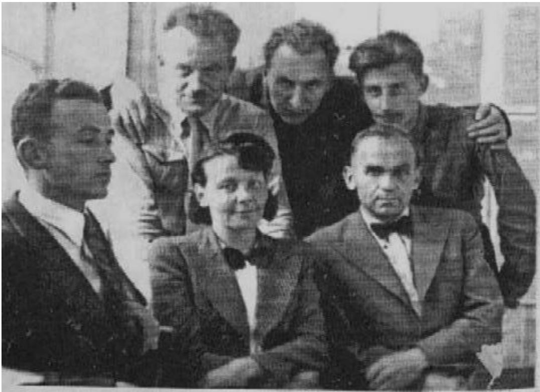
О.Теліга з членами Спілки письменників, 1941 р.