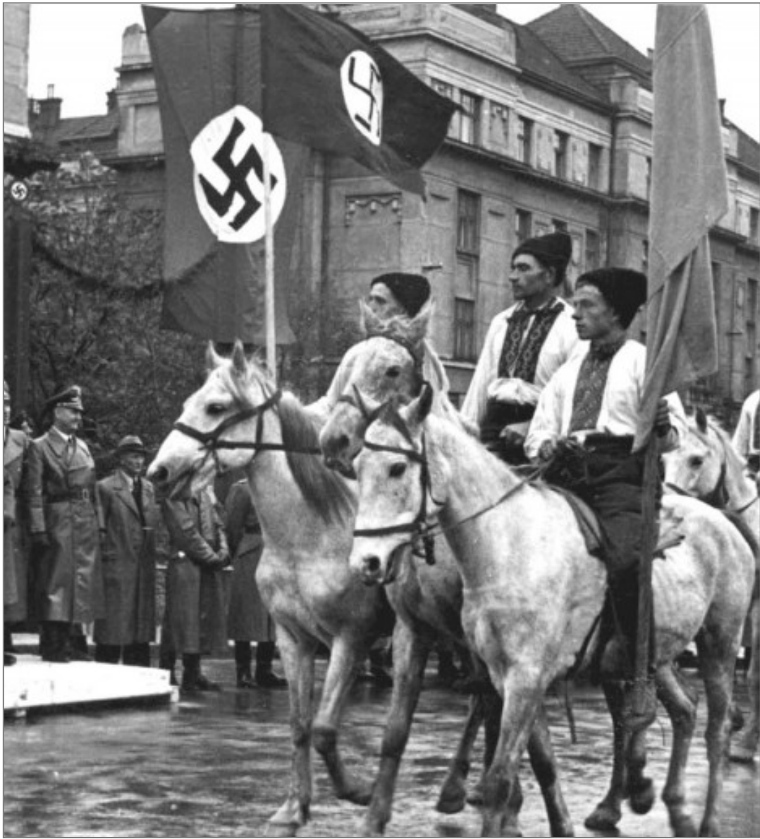
м. Станіславів, 1941 р.