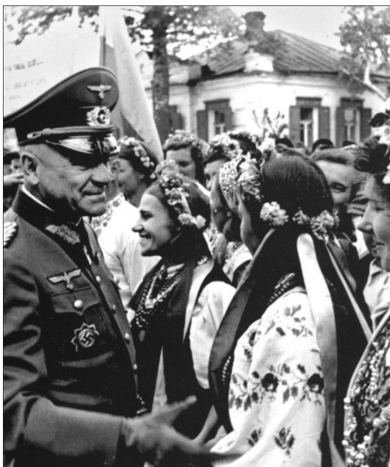
м. Рівне, 1941 р.