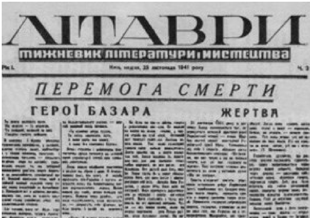
Газета Спілки письменників України