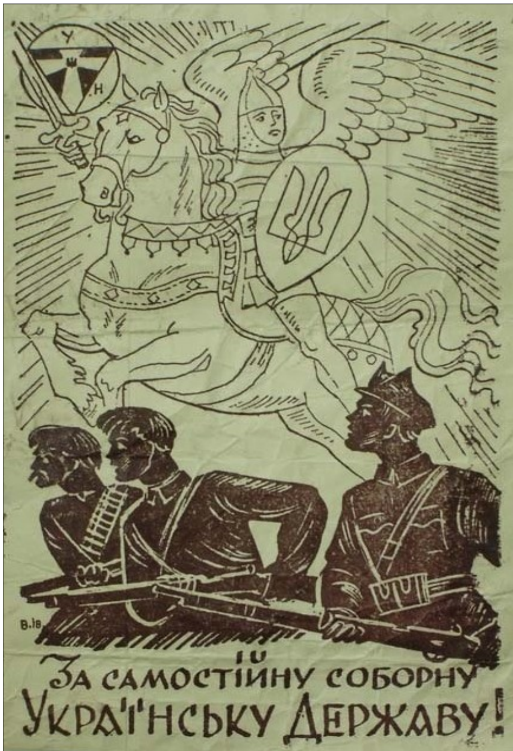
Листівка ОУН «За самостійну соборну Українську Державу», 1943 р.

Державний архів Кіровоградської області, ф. П-5907, оп. 2-р, спр. 13150, арк. 196.