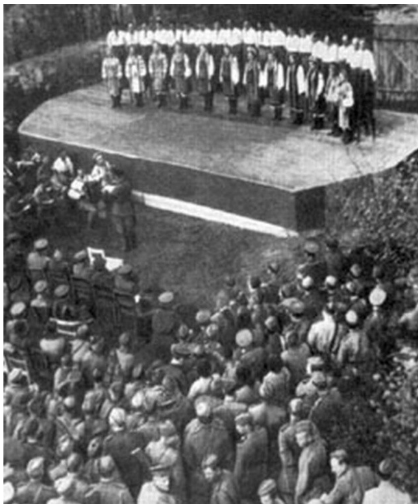
м. Київ, 1942 р.