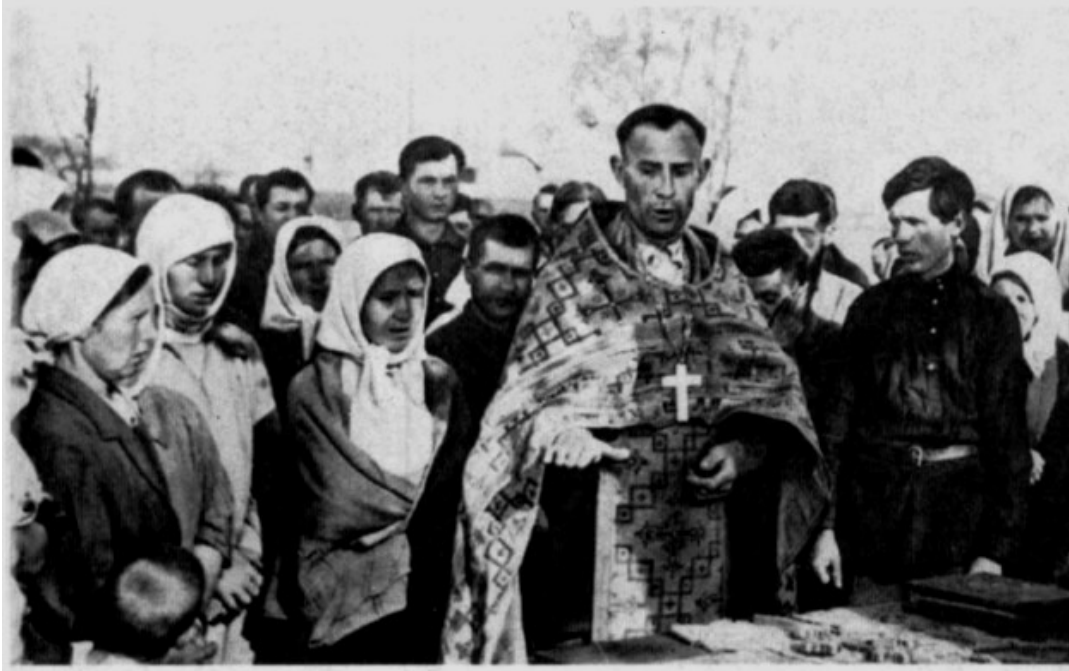
Священик відправляє богослужіння для жителів одного із сіл України. Вересень 1941 р. ЦДКФФА України ім. Г. С. Пшеничного, од. обл. 0-230456