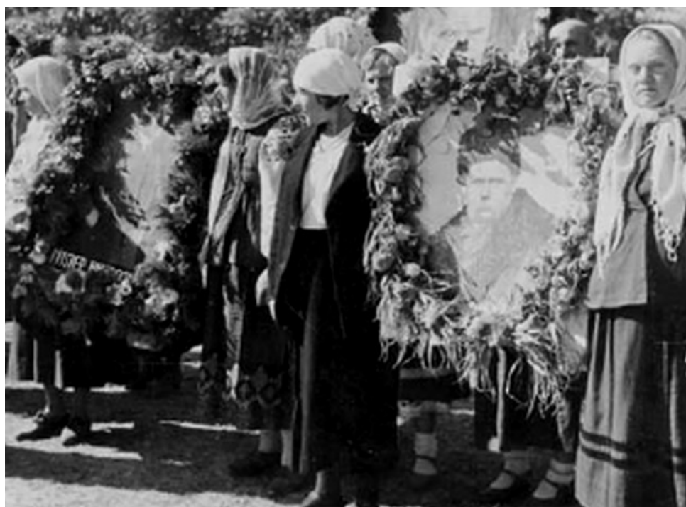
м. Конотоп, 1942 р.