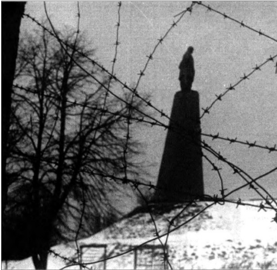
Пам'ятник на могилі Т.Г.Шевченка. Канів Київської обл., 1944 р. ЦДКФФА України ім. Г.С.Пшеничного, од. обл. 0-143125