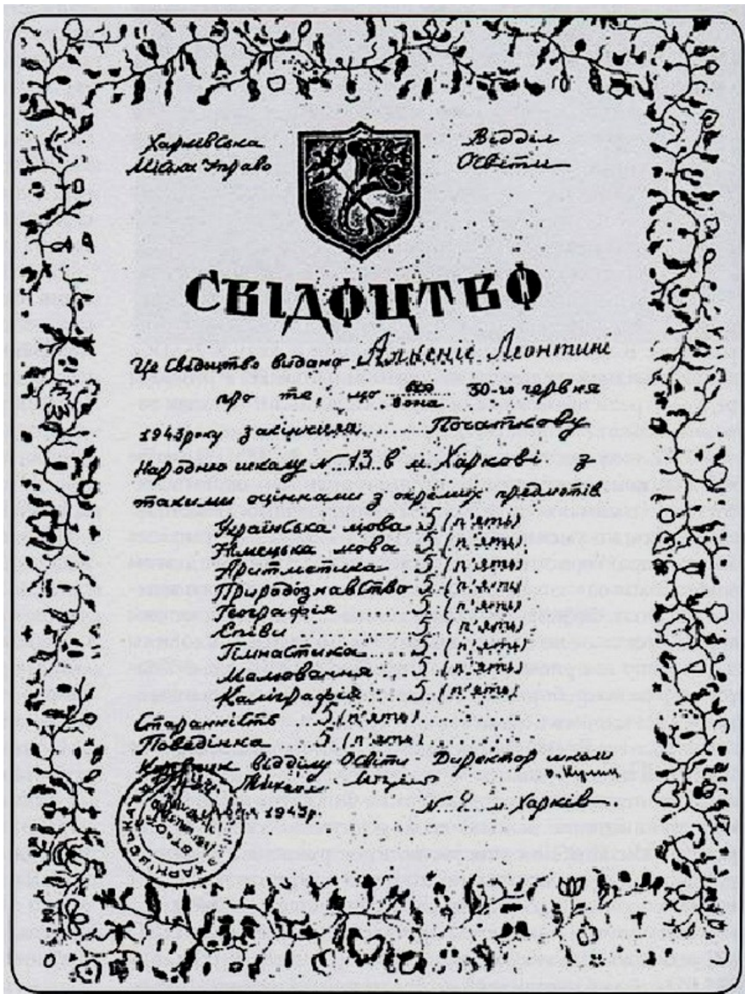
Свідоцтво про закінчення початкової народної школи №13, м. Харків, 30.06.1943 р.