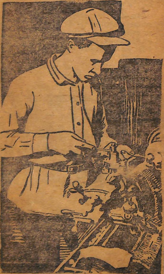
Верімося за політехнізацію шкільних умов за текарним верстатом

Редагує редакція: Васютинський (т. в. о. відп. ред.), Стрижак, Хаваков, Якимчук