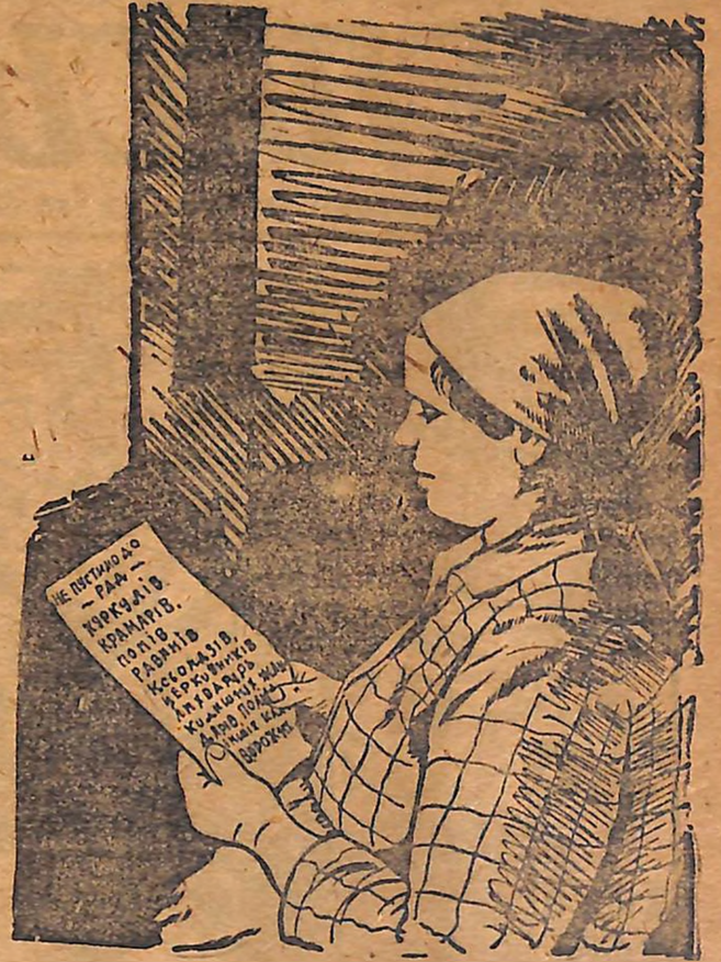
Трудаща жінко, бери участь у кампанії перевиборів рад!

Вимагай відповіді: як боролася рада за організацію поширення та поліпшення громадського харчування робітництва та колгоспників, за організацію житлобудівництва, громадських праць, дитячих ясел, дитмайданчиків.