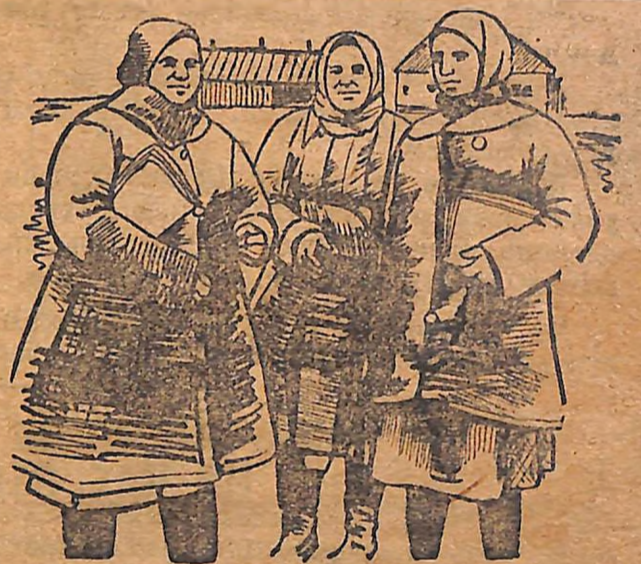
Грудяща жінка повинна бути освічена

Лікнепівці! Включайтесь до лав борців за краще проведення більшовицької сівби, за суцільну колективізацію!