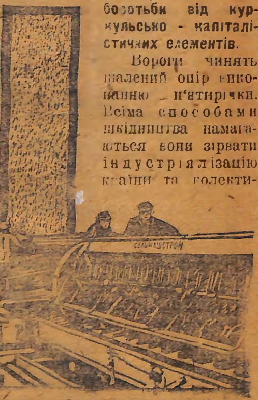
Обсяг сільськогосподарських машин збільшився проти передвоєнного часу в два з половиною рази